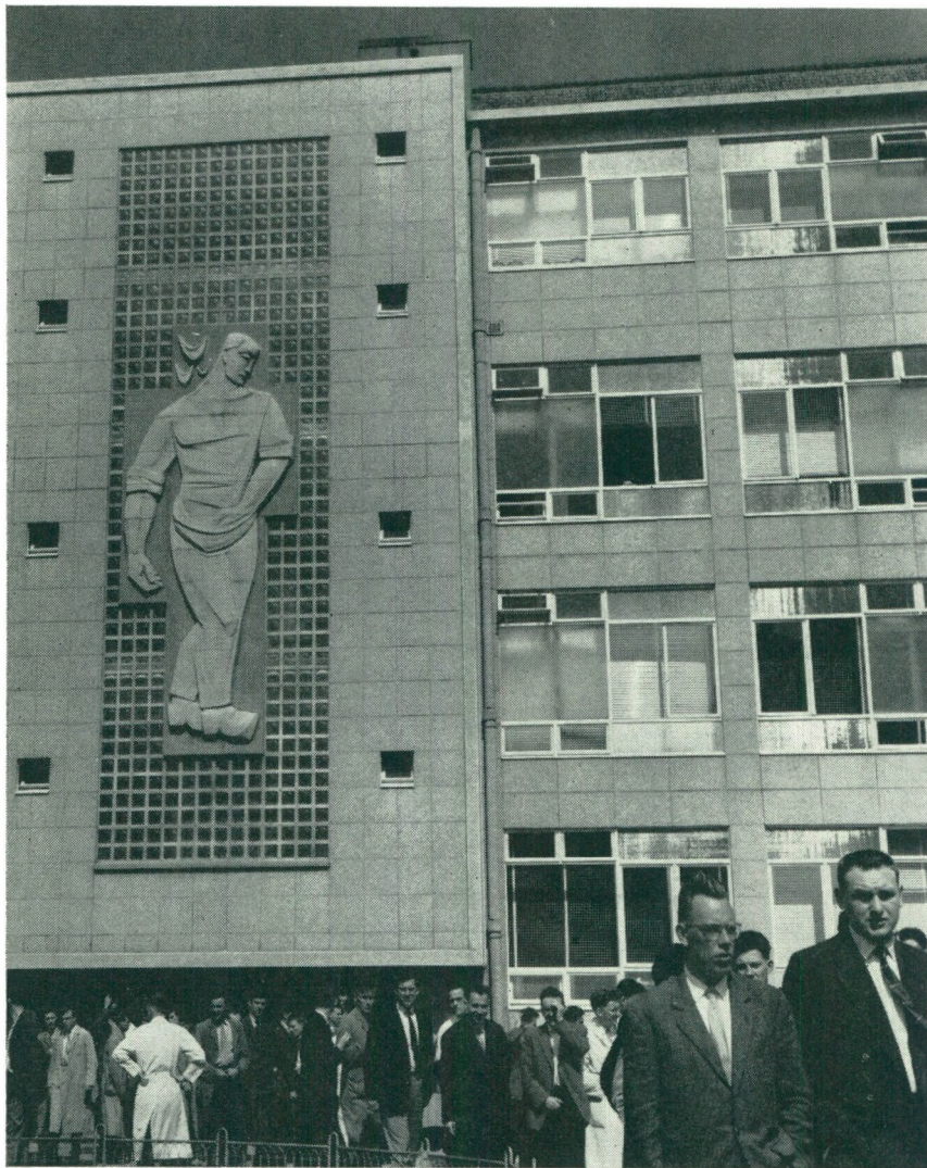
Technische School

Het Westvlaams Economisch Studiebureau publiceerde zopas een belangrijk rapport van 120 blz. over de metaalnijverheid in West-Vlaanderen.